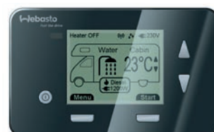
Pannello di controllo digitale