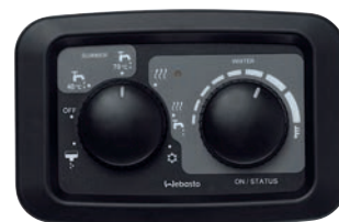
Pannello di controllo manuale